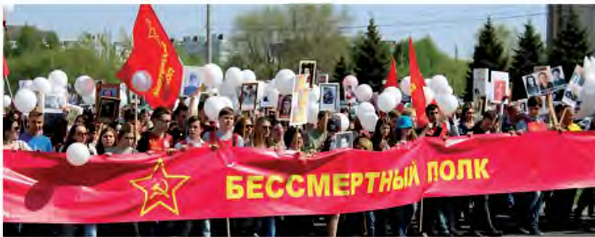
«Нет в России семьи такой, где б не памятен был свой герой...»

Маршрут шествия в этом году сменил «географию» – вместо улицы Революционной «аллеей памяти» был выбран просторный участок по улице Юбилейной – от Свердлова до Приморского бульвара. Кроме того, жители Автозаводского района поддержали жителей поселка микрорайонов Поволжского, Шлюзового и представители всего Комсомольского района: 9 мая портреты тружеников тыла и трудовых армий, детей войны и узников нацистских концлагерей, «блокадников» и партизан пронесли от школы №75 по улицам Гидротехнической и Шлюзовой до площади Никонова. Но не-