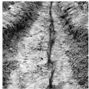
Тольяттиазот поддерживает все экологические инициативы города, в том числе – программу восстановления лесов