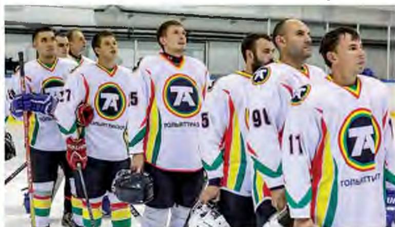
В свой актив занёс игровой сезон 2016-2017 годов хоккейный клуб «Тольяттиазот»

Безусловно, этот сезон наша команда может занести в свой актив. Особенно учитывая то, что наша команда еще очень молода – всего второй сезон ребята играют вместе. За такой короткий период прогресс команды даже удивляет. Пару лет назад некоторые игроки с трудом держались на коньках, а теперь закладывают виражи на зависть профессиональным хоккеистам. Появляется сыгранность, выучка, командный дух. А вместе с ними, уверен, не за горами громкие спортивные победы!