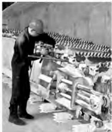
Ремонт большой стрелы портального крана 51-SC-1 занимается цех №23

этап технического перевооружения агрегата №2: расширим систему управления, установим современное динамическое оборудование (насосы и компрессоры), заменим системы вакуумной вытяжки турбокомпрессорного агрегата позиции 14-ТК-1и на отделении двухступенчатой вакуум-выпарки. Кроме того, планируем перевооружение системы обеспыливания воздуха и установки встроенного аппарата охлаждения гранул в кипящем слое на грануляционной башне. Реализация этих мероприятий обеспечит безостановочную работу оборудования, экономии сырья, увеличение производительности и стабильно высокое качество выпускаемой продукции.