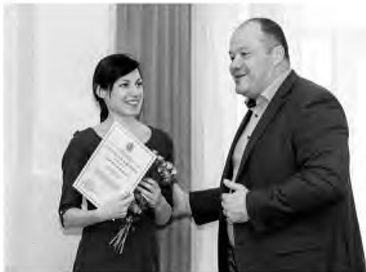
Сотрудники реабилитационного центра вручили награду Тольяттиазоту

Слова благодарности звучали в этот день и в адрес попечителей центра, которые уже много лет активно поддерживают детей и подростков с ограниченными возможностями. В их числе – и наше