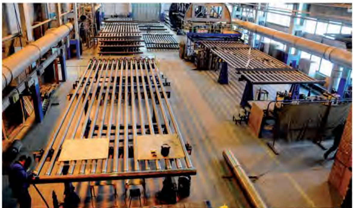
ООО «Реакционные трубы» имеет потенциал к развитию на российских и мировых рынках

Осенью 2016 году ООО «Реакционные трубы» получило первый крупный заказ от стороннего предприятия. Для ООО «Киришинефтеоргсинтез», дочерней компании акционерного общества «Сургутнефтегаз», тольяттинское предприятие не только изготавливает продукцию и ведет монтаж, но и предлагает техно-