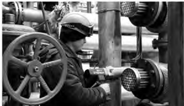
Цех №26 закрывает аппарат Е-17 после промывки теплообменных труб