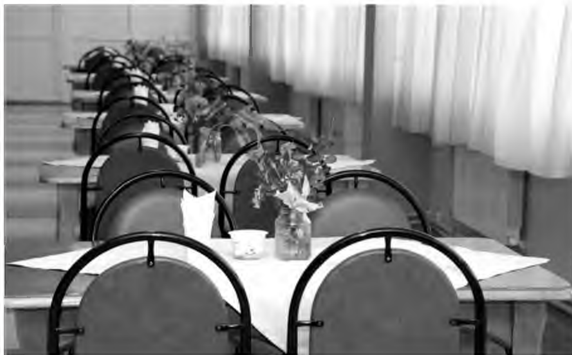
Сытно и аппетитно кормят в столовых Тольяттиазота

Общение сотрудников общепита и заводчан помогает решать и вопросы, связанные с развитием... культуры. В общечеловеческом и корпоративном смысле. Участники опросов выразили пожелание видеть на столах не алюминиевые прибо-