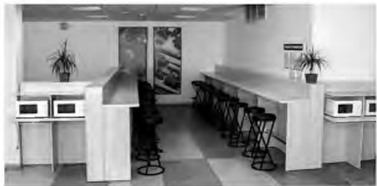
Зона самообслуживания в большом зале столовой заводоуправления

– Мониторинг цен на обеды в общепите показывает: сегодня на Тольяттиазоте можно пообедать значительно дешевле, чем в Комсомольском районе и на предприятиях отрасли в пределах Тольятти. Каждый работник ТоАЗа имеет возможность обедать в заводских столовых по ценам более чем на 40% ниже рыночных (на основе данных 2015 и 2016 годов). В рамках автоматизации учета услуг общественного питания мы занимаемся темой персонификации питающихся. Если говорить о планах на 2017 год в целом, намерены реализовать все пожелания коллег, высказанные в ходе опросов, и улучшить работу службы общественного питания.