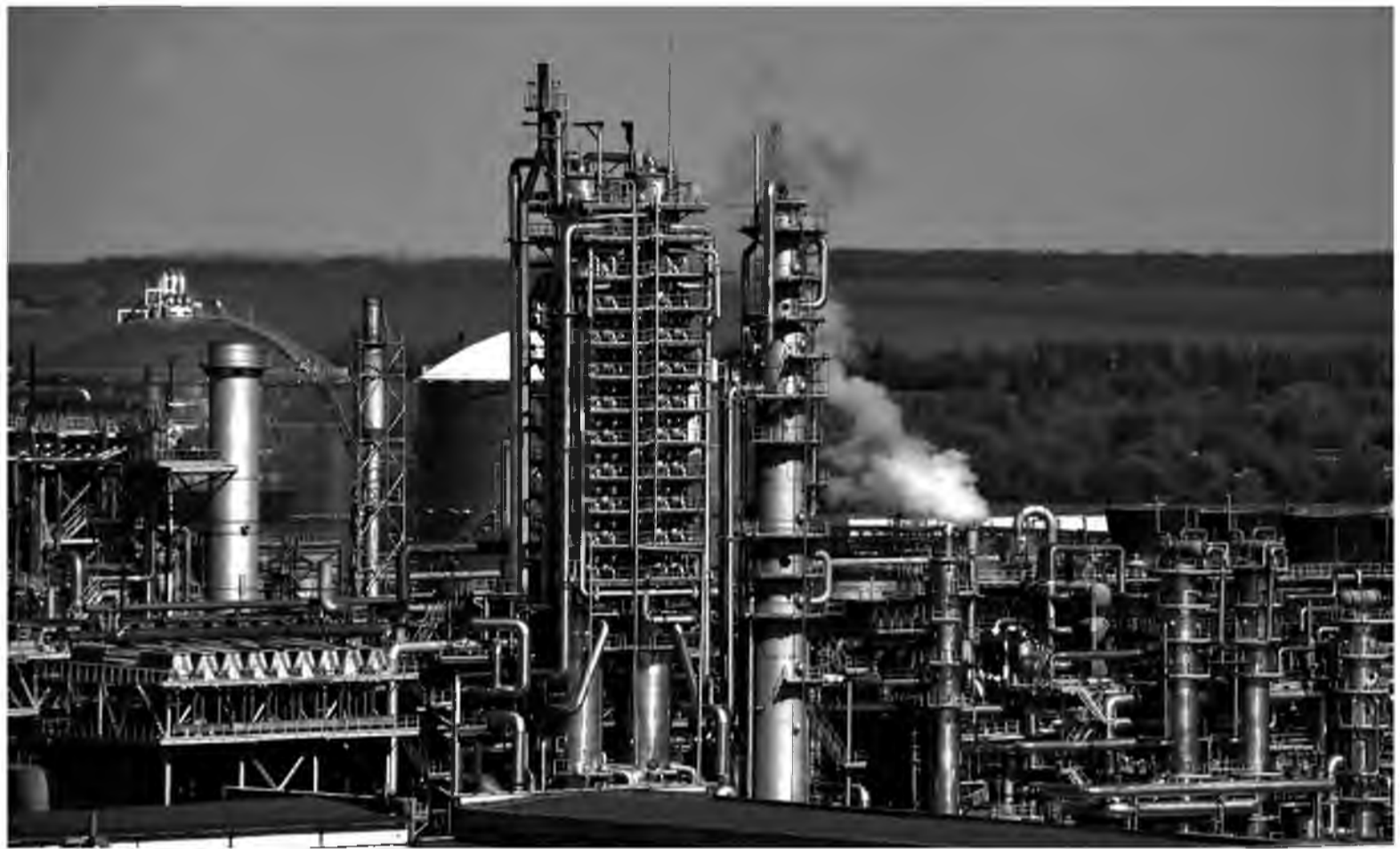
Тольяттиазот считает участок, на котором планируют разместить свалку, спорным и опасным

«Размер инвестиций в новый проект составляет 1 млрд рублей. На его реализацию не будет потрачено ни одного бюджетного рубля. Все инвестиции – это кредитные ресурсы и средства группы компаний «ЭкоВоз», – бодро рапортует автор материала, лишь вскользь упоминая о том, что будущая свалка разместится в двух километрах от промплощадки Тольяттиазота и в пяти – от Васильевки. Не упоминая о мнении предприятия первого класса опасности и жителей близлежащего поселения, которые считают: в проекте есть риски и для развития Тольяттиазота, и для безопасности людей. Молчит газета о том, что рядом с территорией будущей свалки расположены опасные,