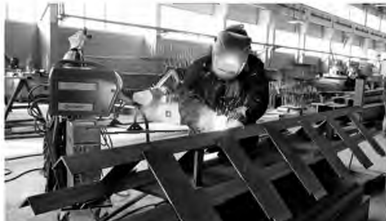
Металлоконструкции площадок обслуживания котла 21В-1 изготавливает цех №93