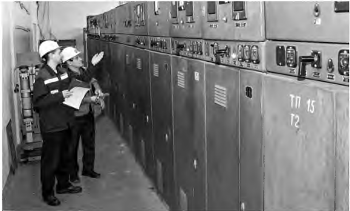
Сотрудники Тольяттиазота обеспечили надежную работу «энергетического сердца» Азотреммаша