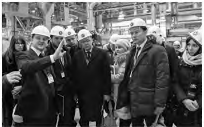
На экскурсии депутаты губернской думы узнали о текущей ситуации и о новых проектах Тольяттиазота

– 65 процентов продукции Тольяттиазот отгружает на внешний рынок, и предприятие чутко реагирует на любые изменения конъюнктуры. Мы продолжаем модернизацию производства и делаем все необходимое для стабилизации финансовых показателей. Информацию о предприятии мы донесли до депутатов губернской думы, и, мне кажется, нас услышали.