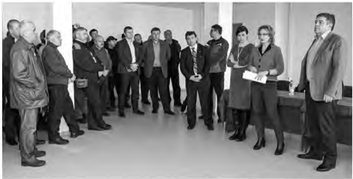
Сотрудники автотранспортного цеха интересовались экономикой предприятия и рассказали о насущных проблемах своего подразделения