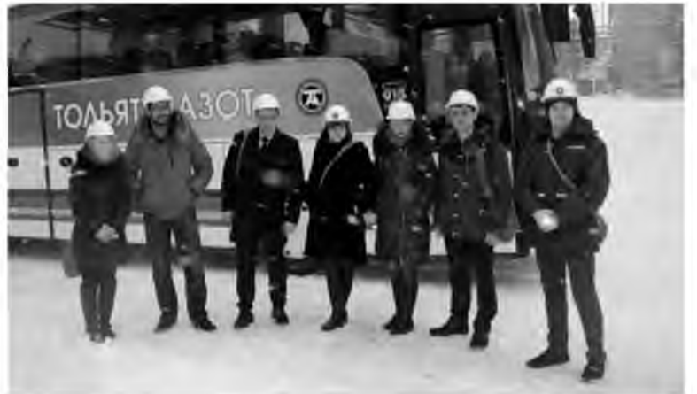
Встреча получилась дружественной и продуктивной. Теперь делегацию ТоАЗа ждут с ответным визитом на АО «Тяжмаш»

Одной из сильнейших сторон Тяжмаша является развитая научно-практическая деятельность. Например, на базе АО «Тяжмаш» совместно с Сызранским филиалом Самарского государственного технического университета (СамГТУ) осуществляется уникальный образовательный проект «Базовая кафедра «Технология машиностроения».