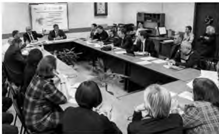
Тольяттиазот ведет экологическую просветительскую работу в разных аудиториях и для всех возрастов