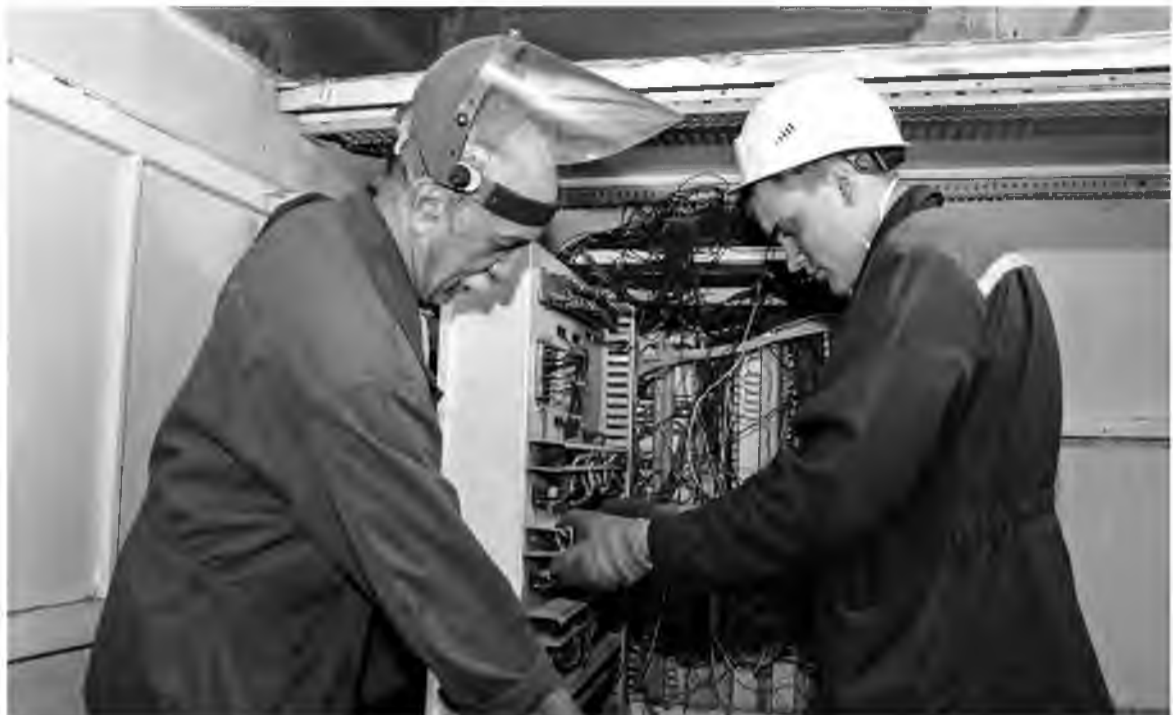
Цех №28 ведёт подключение новой АСУ ТП компрессора CO 2