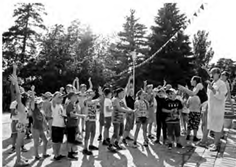
Тоазовцы довольны тем, как их дети проводят время в «Радуге»

Всего в этом сезоне в оздоровительных учреждениях отдохнут 109 детей работников Тольяттиазота.