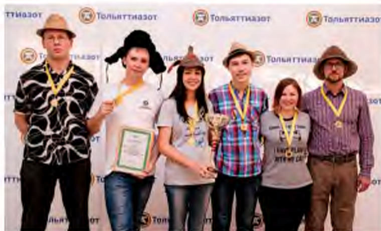
Шапки принесли удачу чемпионам

себя. Знаешь ли ты, что такое жалея, чеботарь, зрелки, бабайка, жбан, лыко.