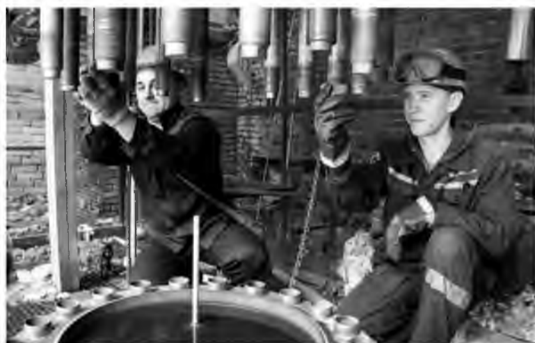
Цех №118 занимается ремонтом стриппера на отделении синтеза