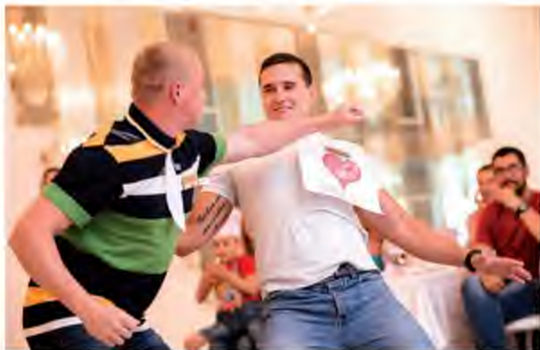
Любовная драма от «ТХБ и Компания»