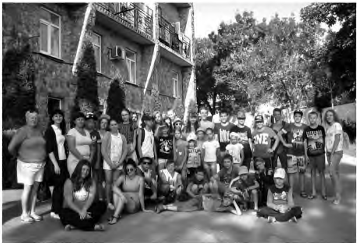
В «Мечте» царит домашняя атмосфера

В лагере была насыщенная спортивно-развлекательная программа. Она включала в себя разнообразные спортивные игры на площадках, игры в теннис,