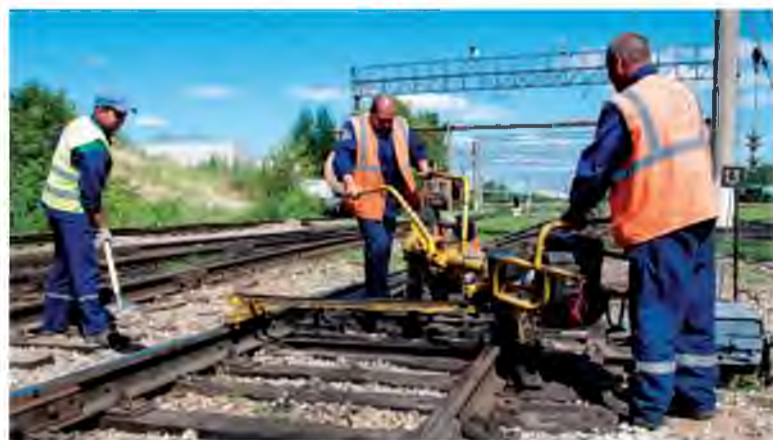
День железнодорожника монтеры пути каждый год встречают ударными темпами