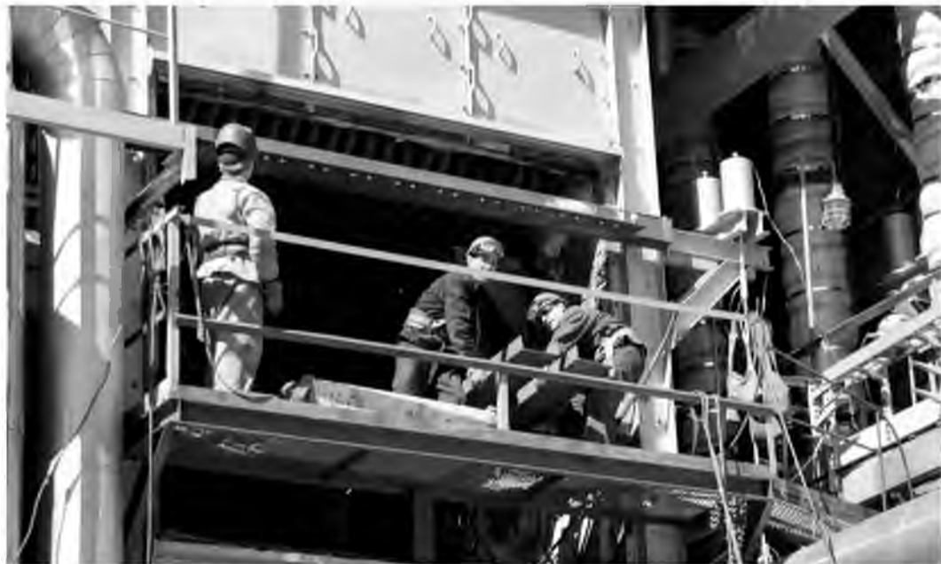
Бригада цеха №100 выполнила демонтаж змеевика ПВС печи риформинга позиции 107