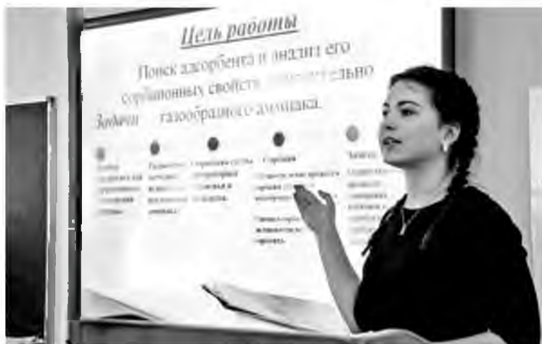
Путь в науку и производство начинается с общения с экспертами химической отрасли