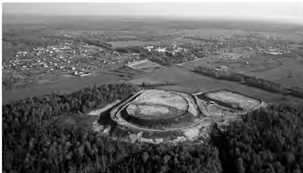
Мусорный «парфюм» много лет отравляет воздух жителям подмосковного города Балашихи

Проблема остро стоит и в Московской области, и в Татарстане, и в Туле, и в некоторых других регионах, сказал Владимир Путин. Для ее решения, в частности, принято решение о строительстве современных мусороперерабатывающих заводов, три из которых появятся в Подмосковье. Нужно сделать как можно скорее, считает глава государства. «А что касается Балашихи, то позанимаемся отдельно. Я прекрасно понимаю и вижу остроту этой проблемы, она складывалась годами», – сказал Путин, пообещав решить проблему как можно скорее. Так, из федерального бюджета выделены 5