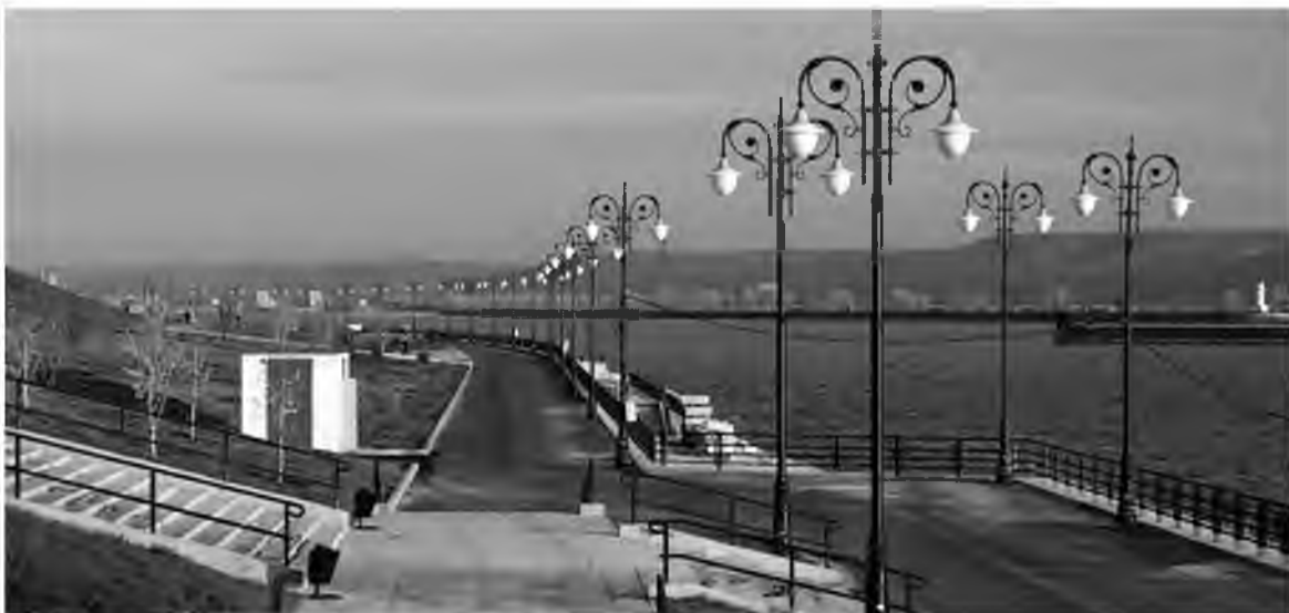
Набережная Комсомольского района, один из «фасадов» Тольятти, давно требует внимания и инвестиций