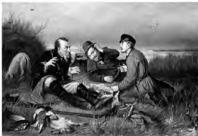
Народное мнение: картина Василия Перова «Охотники на привале» приносит удачу и благополучие

– Девятка?! Это кого ты собрался стрелять, мух что ли? Это самая маленькая дробь. Девятка